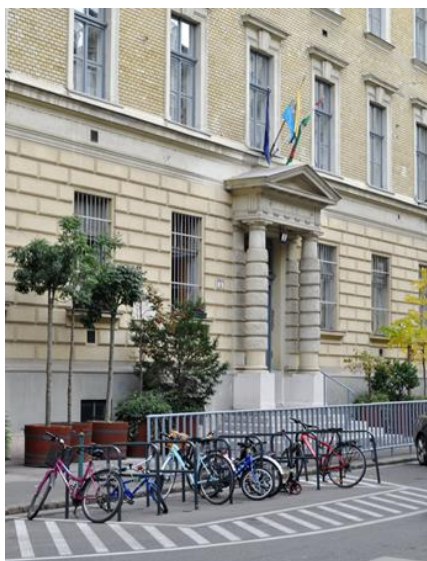
Szemere Bertalan Általános Iskola 1054 Budapest, Szemere u. 5.

Tel: 872-7801 Fax: 872-7824 Email: szemere-iskola@belvaros-lipotvaros.hu Honlap: www.szbh.hu